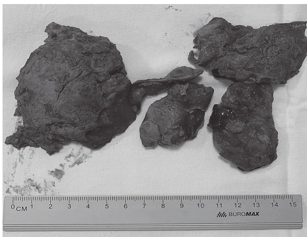
Рис. 3. Макропрепарат видаленої аневризми верхівки лівого шлуночка з пристінковим тромбом.

проведена аневризмектомія з тромбектомією лівого шлуночка в НІССХ ім. М.М. Амосова (рис. 3).